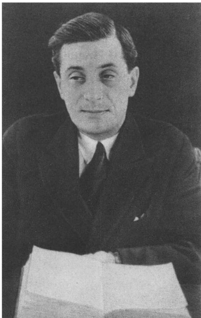
М. М. Зошенко. 1939—1940 гг.