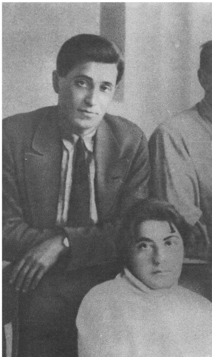
М. Зоценко и М. Шагинян. 1928 г.