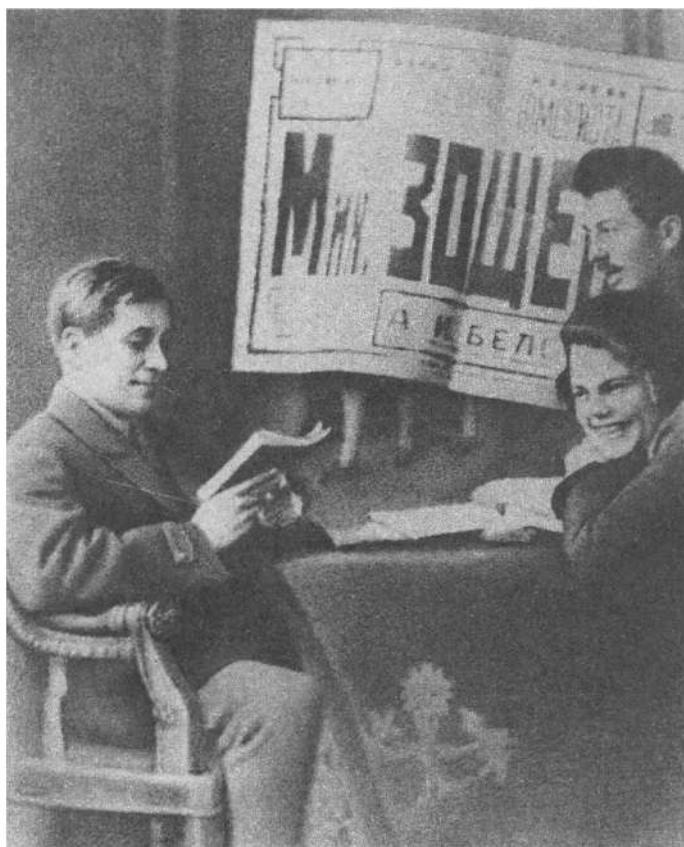
М. М. Зощенко читает свой новый рассказ. Харьков. Конец 20-х гг.