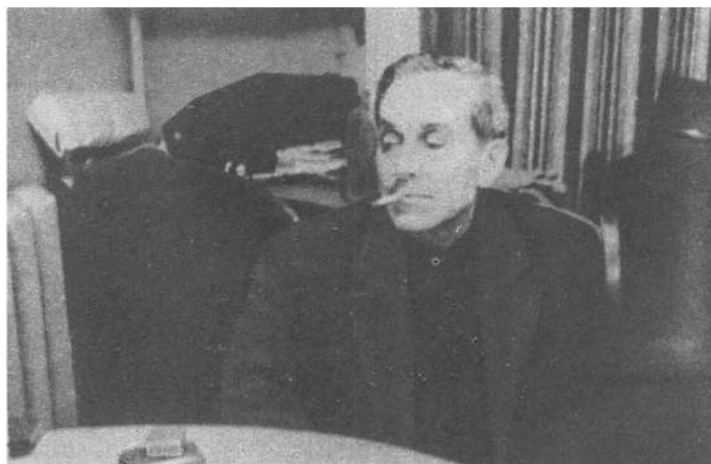
М. М. Зошенко. 1958 г.