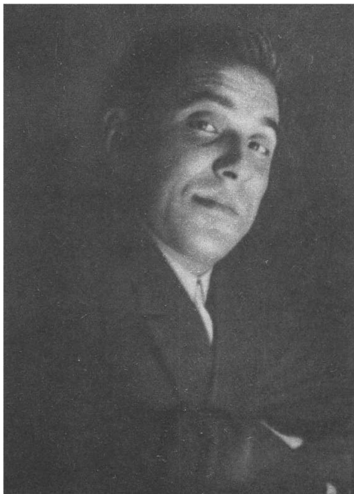
М. М. Зошенко. 1933—1934 гг.