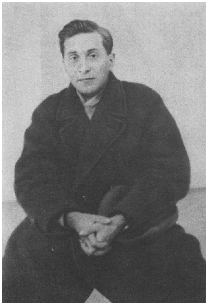
М. М. Зощенко. Начало 30-х гг.