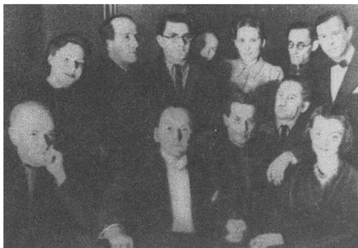
М. М. Зошенко среди гостей вернувшегося на родину А. Вертинского. Декабрь 1943 г.