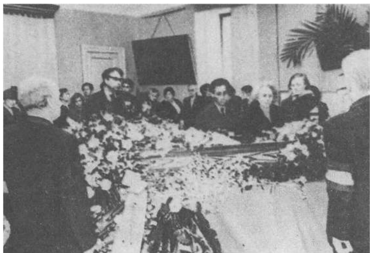
Гражданская панихида в Доме писателей им. Маяковского.