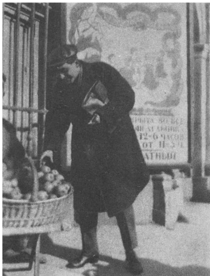
М. М. Зошенко. 1923 г.