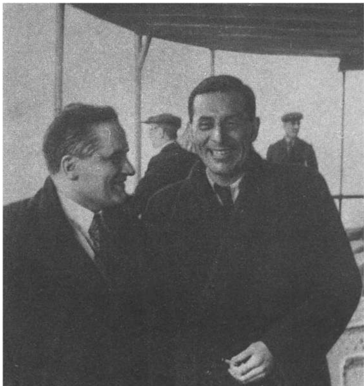
М. Зонченко и Ю. Олеша. Вторая половина 30-х гг.