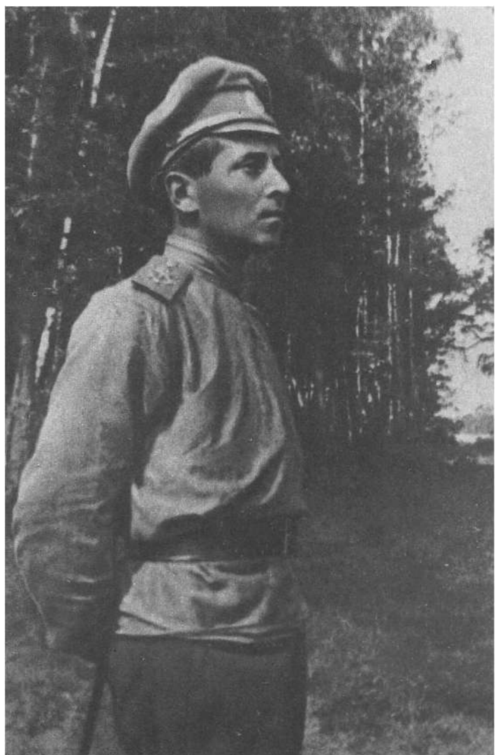
М. Зощенко на русско-германском фронте. 1915 г.