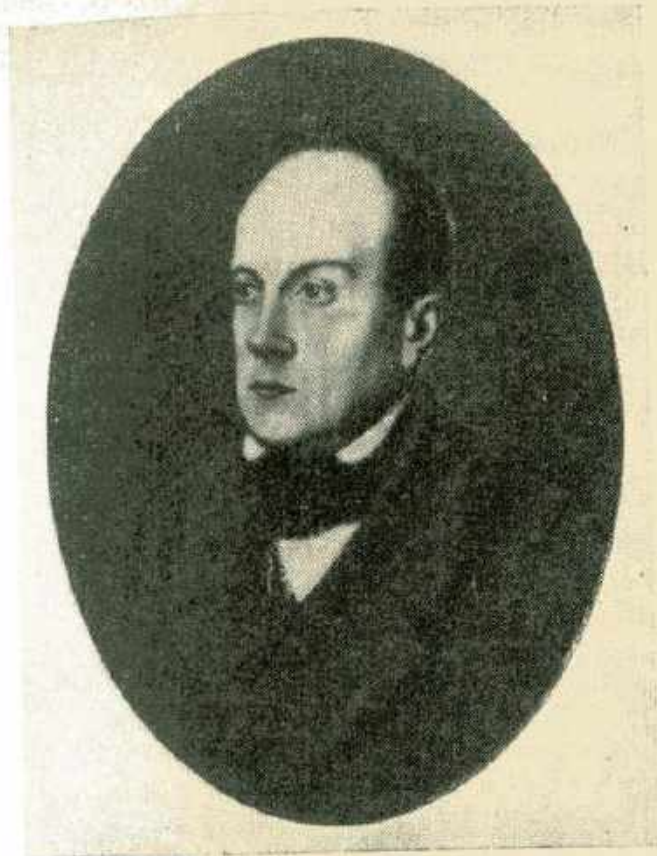
Петр Яковлевич Чаадаев. Портрет Козима (?). Середина 1840-х гг.

легче дошли до молодого поколения, преимущественно выразившись в нарождавшемся новом движении. Это были те библейские праведники, которыми спасался город... В числе этих немногих представителей преданий разбитого, но не побежденного освободительного движения видное и независимое место занимал П. Я. Чаадаев». Он «выступал со словом обличения против пошлости, против отступничества, он проповедовал, он обличал, он рассказывал более молодым людям в поучение о времени своей молодости, о политическом движении при Александре I, о тайных обществах, о декабристах, об их деле». 3 Нет сомнения в том, что рассказ Вячеслава Евгеньевича основан на воспоминаниях отца, который и был одним из этих молодых людей, более чем внимательных слушателей «басманного отшельника». Огромный интерес к людям 14 декабря, уже заложенный семейными преданиями, еще