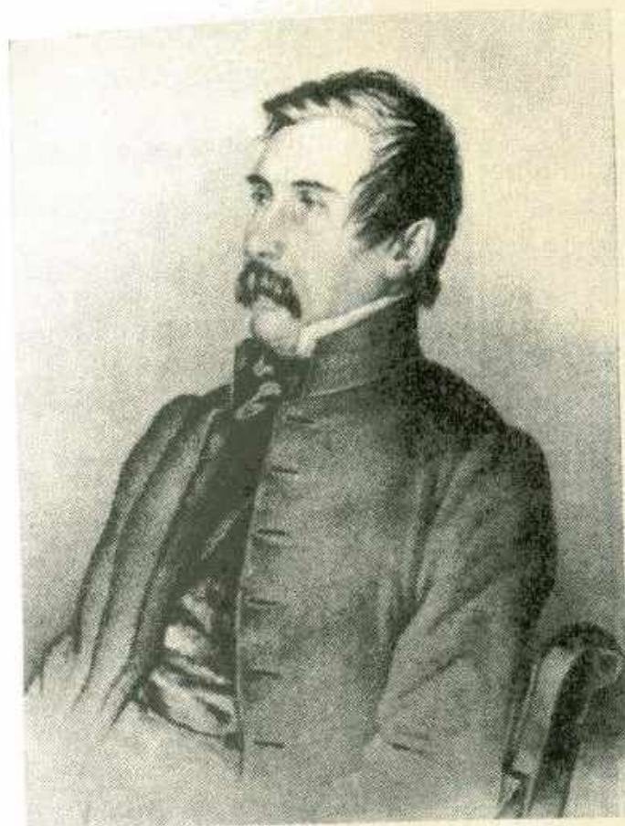
Иван Иванович Пущин. 1850 г.