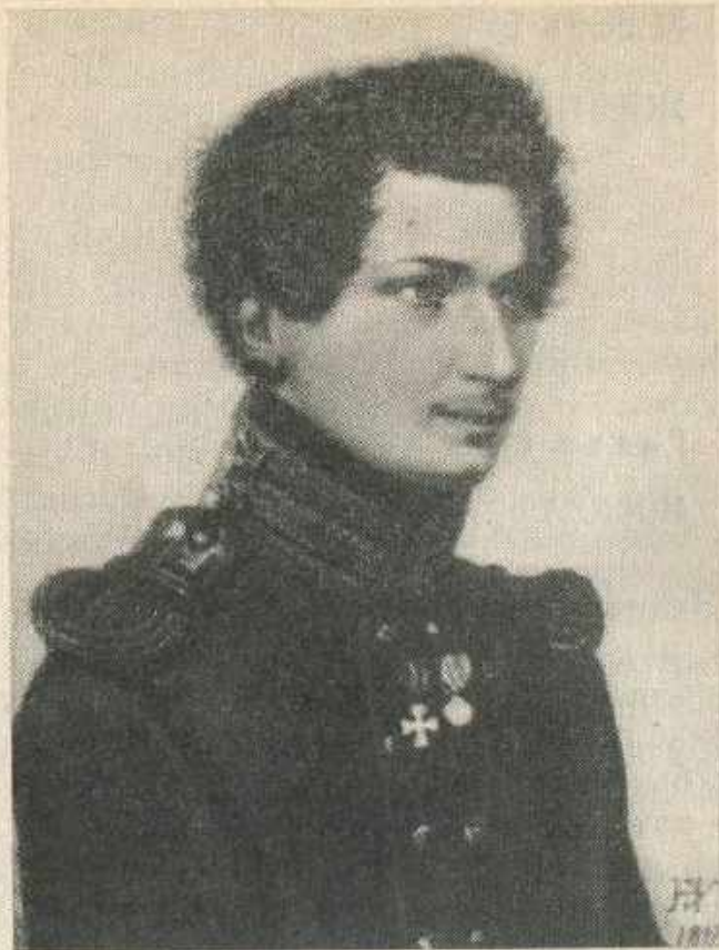
Иван Дмитриевич Якушкин. Портрет Н. Уткина. 1816 г.

тельной красоты, — писал впоследствии декабрист Н. В. Басаргин. — Нам было тяжело, грустно смотреть на это юное, прекрасное создание, так рано испытывающее бедствия этого мира». 2