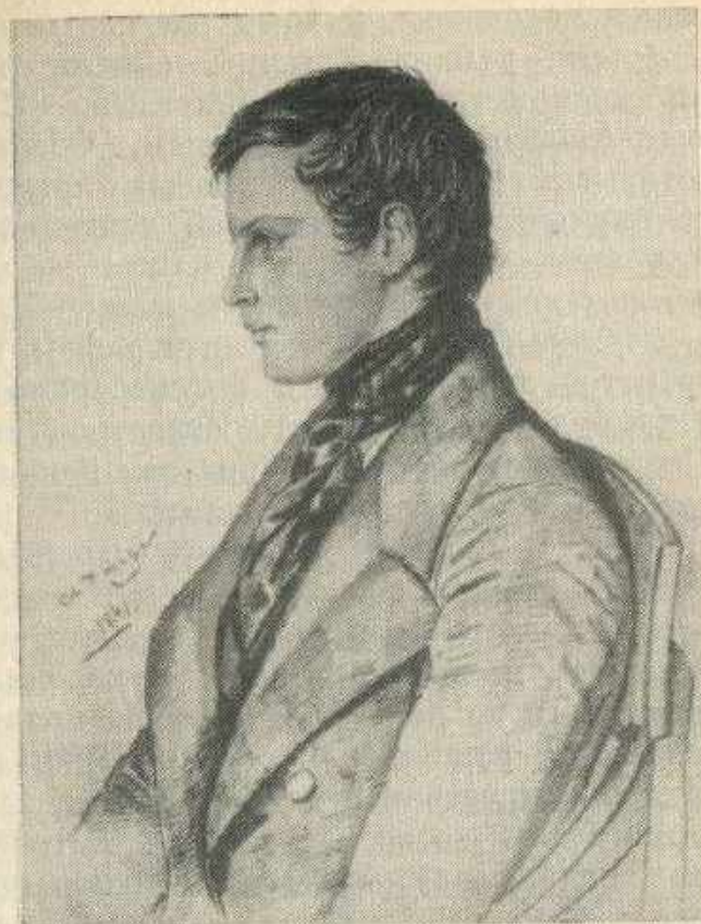
Евгений Иванович Якушкин. Рис. К. Мазера, 1841 г. Публикуется впервые.

Во дворе дома Иван Дмитриевич установил столб для метеорологических наблюдений, чрезвычайно сму-